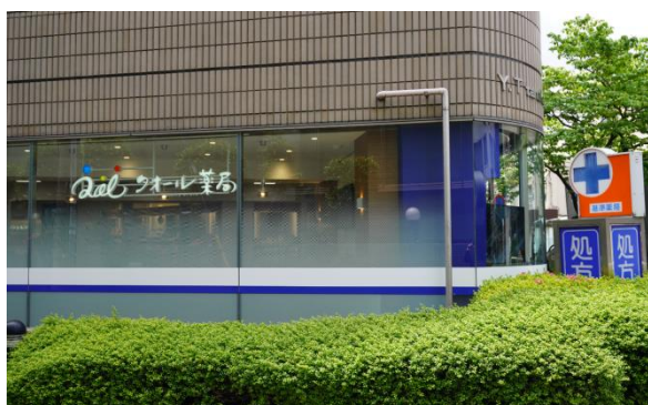
※クオール薬局恵比寿店

クオール薬局様ではこれまで処方箋医薬品等を店頭での受渡しのほか、宅配便や郵便受けに入れるポストインサービス、京都ではロッカー受取サービスを行ってまいりました。この度あらたに「PUDO ステーション」を利用することで、お客様は服薬指導を受けた後、お好きな時間に非接触・非対面にて処方箋医薬品等の商品を受け取ることができ、コロナ禍においては感染症の拡大防止にもつながる利便性・安全性の高いサービスとなります。